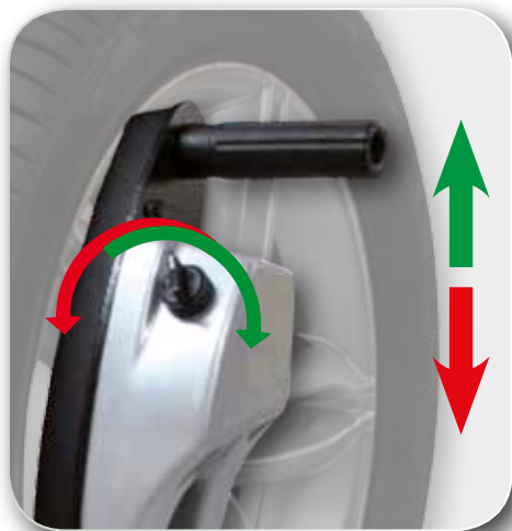
AUTOMATIQUE - AUTOMATISCH